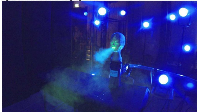
Figuur 2: DNW visualisaties aerosolen

Resultaat: met metingen uitgebreide simulatiemodellen voor de bepaling van de besmettingsrisico's van SARS-CoV-2 aan boord van vliegtuigen.